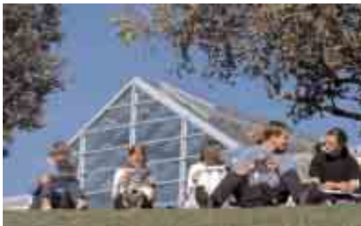
Kunnskaps- og teknologibyen Trondheim, et naturlig tyngdepunkt i Det Digitale Trøndelag.

Hovedmålet for fosen.net har vært å etablere interaktive veivisere til forvaltningens tjenester med bruk av digital signatur og data fra kommunene.